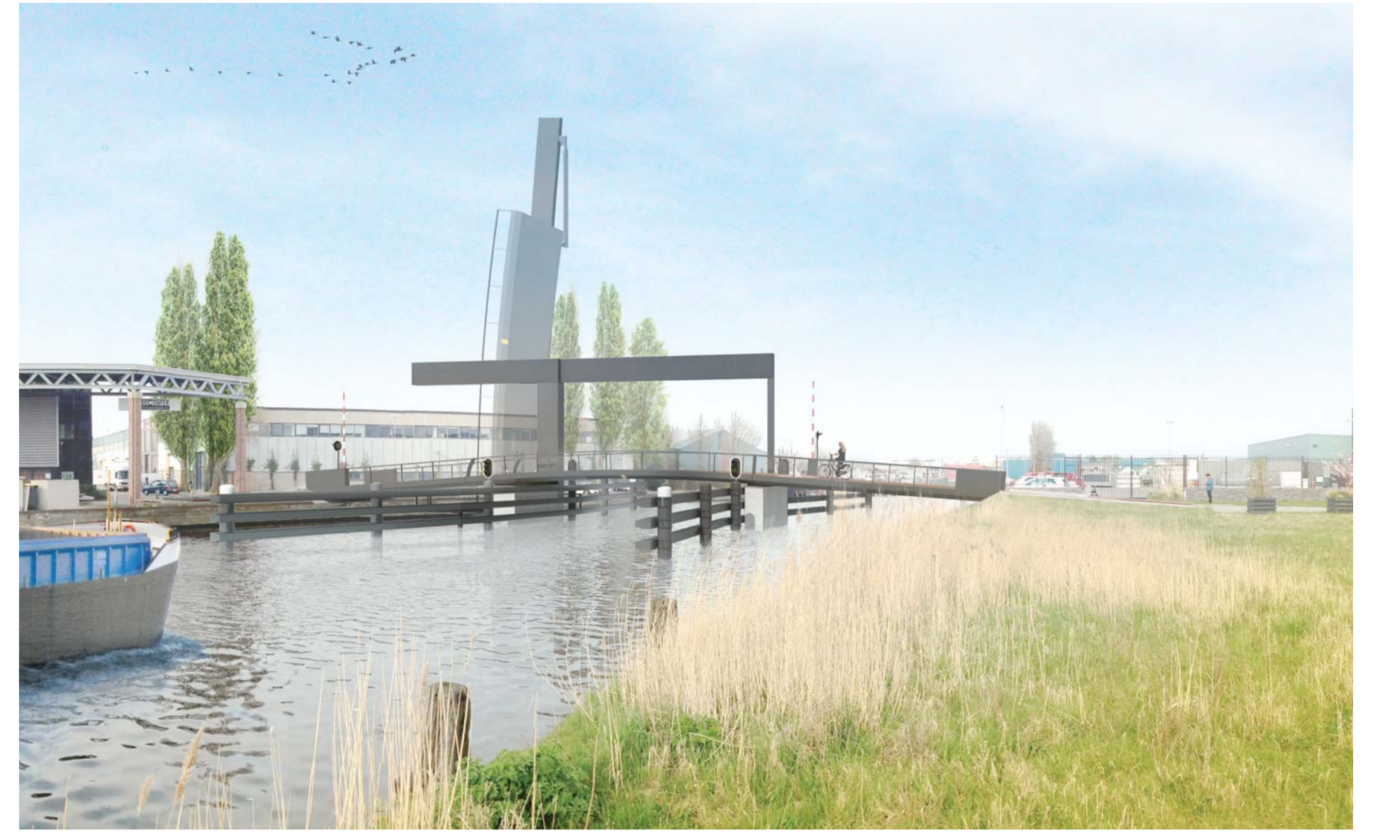
impressie van het ontwerp

Installaties zijn zoveel mogelijk geïntegreerd in het ontwerp. Het bewegingswerk bevindt zich in de hameitoren achter een 8 meter hoge onzichtbare deur, de aansturing is opgenomen in de hekwerken en de verlichting ten behoeve van het aanlichten van het dek is geïntegreerd in de balansriem.