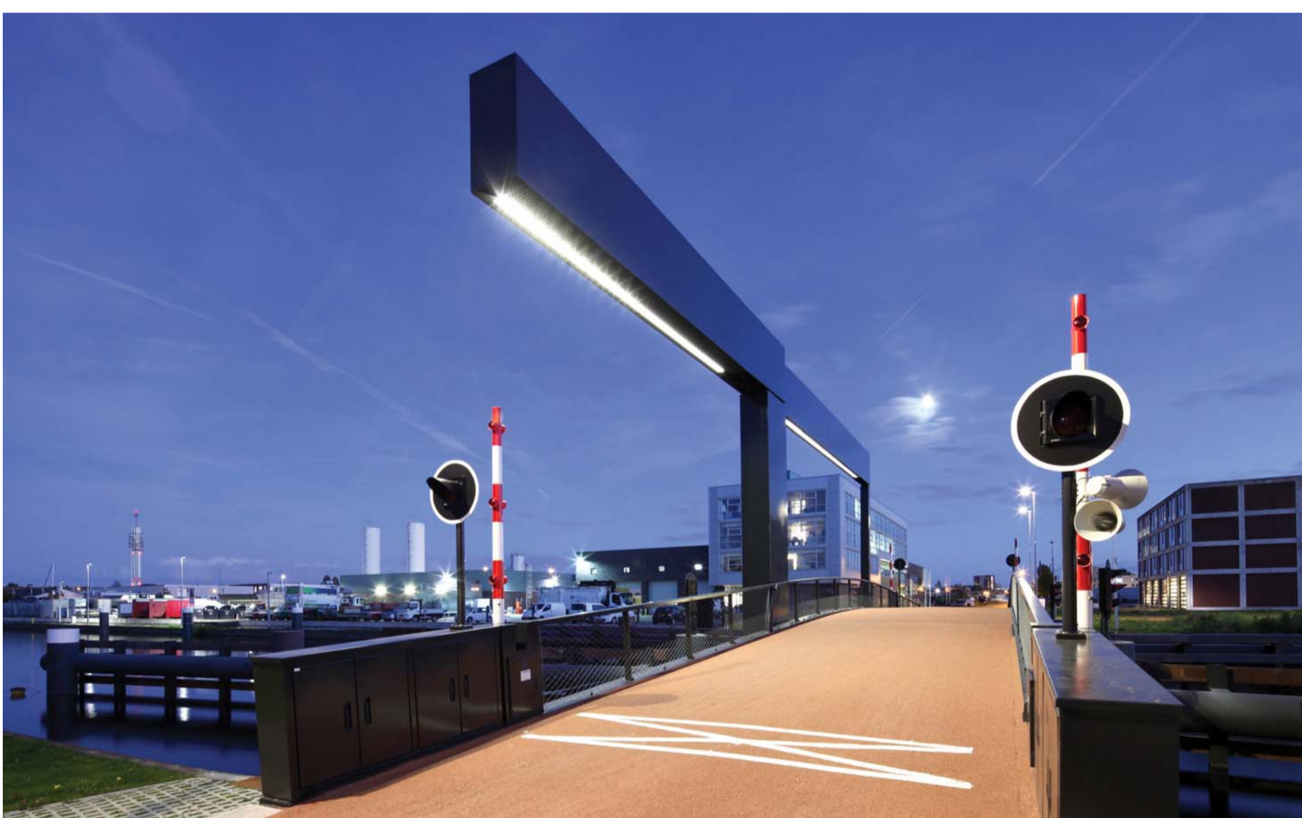
Figebrug gezien vanaf de Hendrik Figeeweg